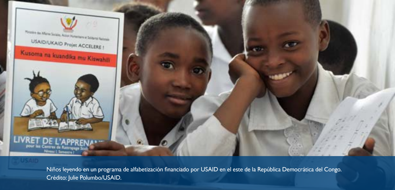
Niños leyendo en un programa de alfabetización financiado por USAID en el este de la República Democrática del Congo.