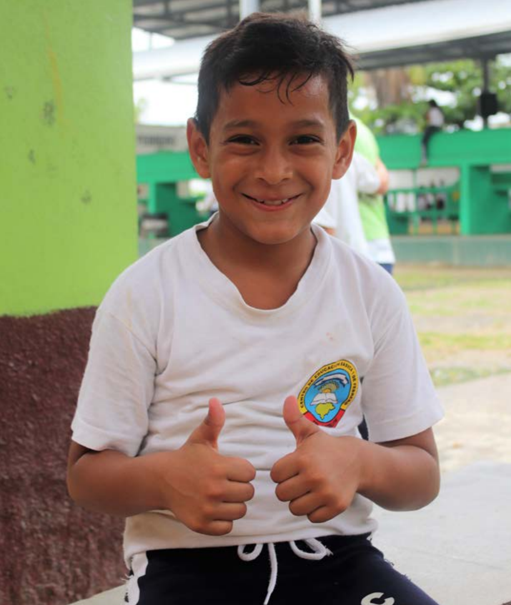
Un estudiante de San Pedro Sula, Honduras, participando en un programa financiado por USAID que previene la violencia, brinda consejería a los estudiantes afectados por la violencia y fortalece las comunidades.