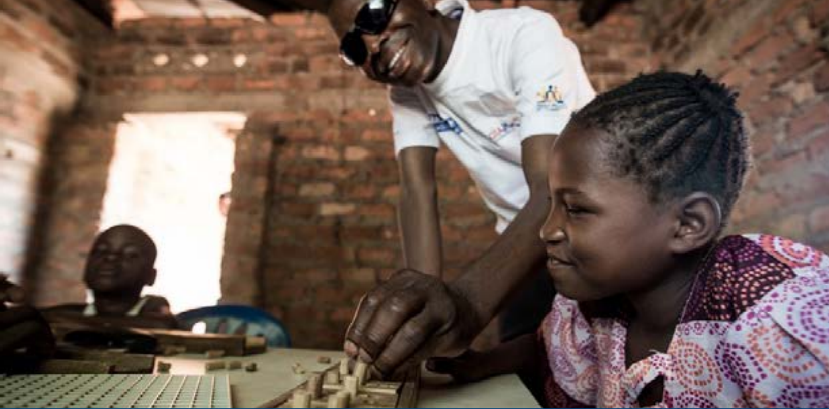
Teacher instructs blind students in braille at USAID-funded program in the Democratic Republic of the Congo.