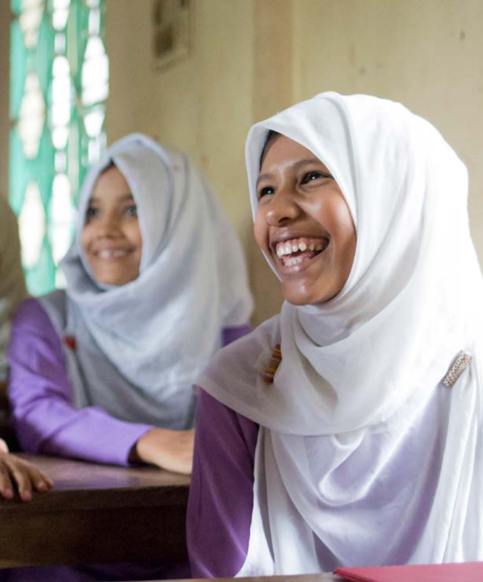
Estudiantes en Bangladesh durante un Análisis Rápido de la Educación y de los Riesgos realizado por USAID.