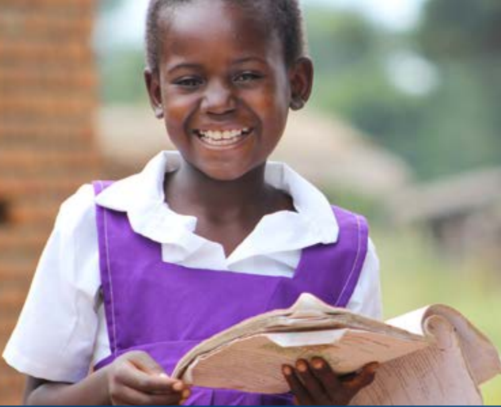
Niña en el programa de lectura de primer grado en Malawi.