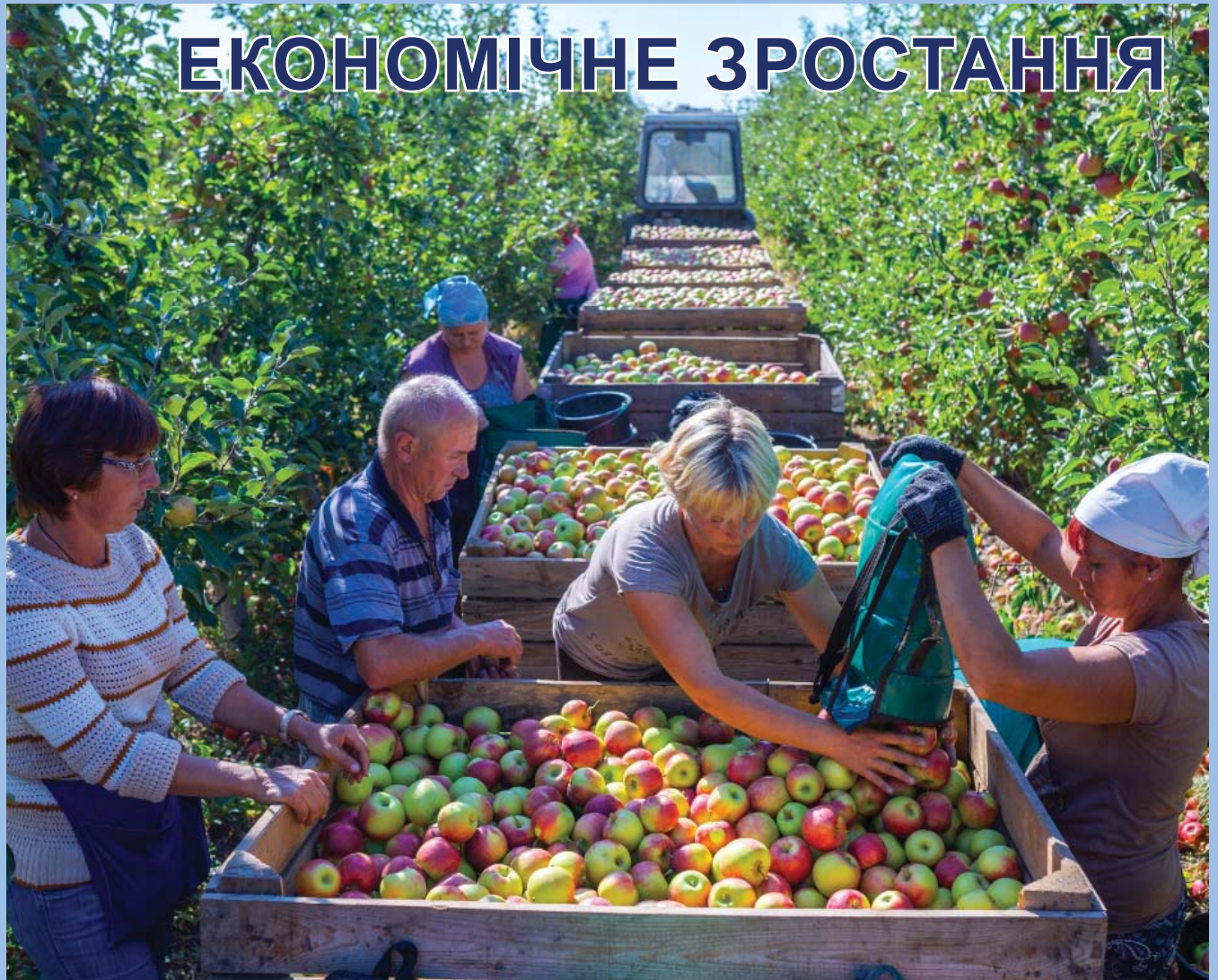
Збір врожаю на с/г підприємстві «Сади Донбасу» (село Полтавка, Донецька обл.)