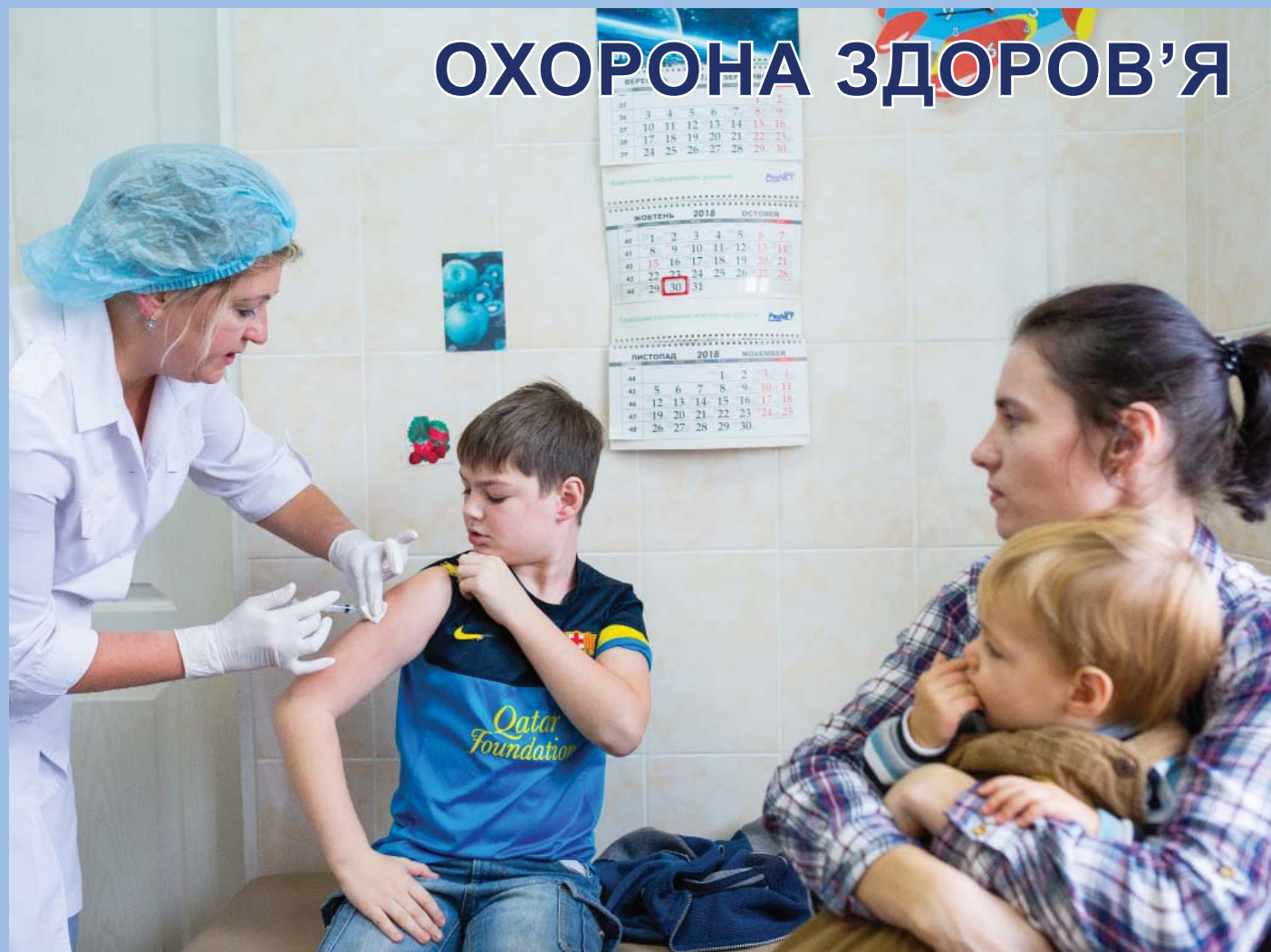
Юний пацієнт отримує щеплення у центрі первинної медичної допомоги у Києві