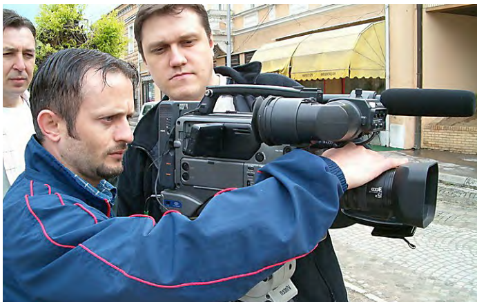
Obuke novinara koje je finansirao USAID pomogle su da se unapredi profesionalnost novinarstva u Srbiji.

MEDIJI: Između 2001. i 2012. godine, USAID je pomogao razvoj nezavisnih medija kao uspešnih komercijalnih preduzeća. USAID je finansirao izvore ozbiljnog izveštavanja i istraživačkog novinarstva, uključujući novinsku agenciju BETA, bivšu TV stanicu B92, radio stanice i internet portale. Skoro 1.500 novinara i drugih medijskih radnika prošlo je obuku, a više od 250 medijskih kuća dobilo pomoć USAID-a.