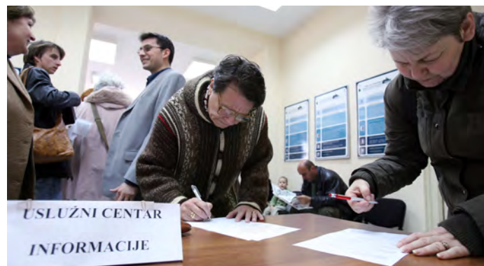
U saradnji sa lokalnim samoupravama, USAID je osnovao 32 uslužna centra širom Srbije i time omogućio da građani dobijaju bolje usluge u opštinama u kojima žive. Uslužni centar u Zrenjaninu.

LOKALNA SAMOUPRAVA U SLUŽBI GRAĐANA: Zahvaljujući pomoći američke vlade, uvedena je elektronska uprava u 83 opštine i osnovani su opštinski uslužni centri u 32 opštine u Srbiji, olakšavajući građanima da promene prijavu prebivališta, izvrše prijave ili dobiju izvode iz matičnih knjiga rođenih i venčanih.