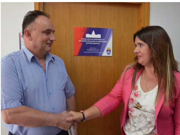
Poslaničke kancelarije koje je podržao USAID omogućavaju građanima Srbije direktan kontakt sa njihovim izabranim predstavnicima. Poslanička kancelarija u Rakovici, Beograd.

POLITIČKI PROCESI: USAID je radio na razvijanju institucionalnog kapaciteta vlade, političkih stranaka, Narodne skupštine i civilnog društva dajući doprinos ključnim reformama, unapređujući način odlučivanja, podižući zainteresovanost građana da učestvuju u političkom životu i podržavajući slobodne i fer izbore. USAID je pomogao uključivanje žena i manjinskih grupa u političke procese. Poslaničke kancelarije koje je podržao USAID omogućile su građanima Srbije direktan kontakt sa svojim izabranim predstavnicima.