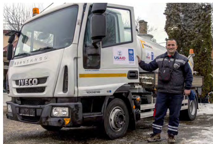
Kroz unapređenje infrastrukture i donaciju opreme, kao što je ovaj kamion za čišćenje tečnog otpada namenjen opštini Šid, USAID je pomogao Šidu da se izbori sa izazovima migrantske krize.

REAGOVANJE U VANREDNIM SITUACIJAMA: USAID je takođe pomogao lokalnim zajednicama da efikasnije reaguju na vanredne situacije. Na primer, USAID je obezbedio više od 2 miliona dolara pomoći Srbiji za reagovanje i oporavak nakon poplava 2014. USAID je obezbedio i 2 miliona dolara za lokalne zajednice pogođene migrantskom krizom. Ova sredstva pomogla su opštinama da unaprede socijalne i zdravstvene usluge i stavilo ih u bolji položaj da adekvatno odgovore na krizu i budu u službi građana. Ova pomoć značila je i nove rezervoare za vodu u Preševu i Tutinu koji su omogućili pouzdano vodosnabdevanje stanovništva, nove prostorije hitne pomoći u Domu zdravlja u Bosilegradu, medicinsku opremu za Dom zdravlja u Subotici, opremu za javnu kuhinju u Subotici, kao i nove prostorije obrazovne ustanove u Kikindi i brojne druge projekte.