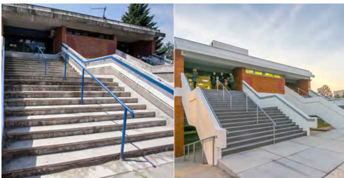
Renoviranje Prekršajnog suda u Beogradu, koje je finansirao USAID, pojednostavilo je rad suda, unapredilo upravljanje predmetima i sud građanima učinio pristupačnijim.

PREKRŠAJNI SUDOVI: Zahvaljujući pomoći od strane USAID-a obnovljeni su prekršajni sudovi širom Srbije i unapređen