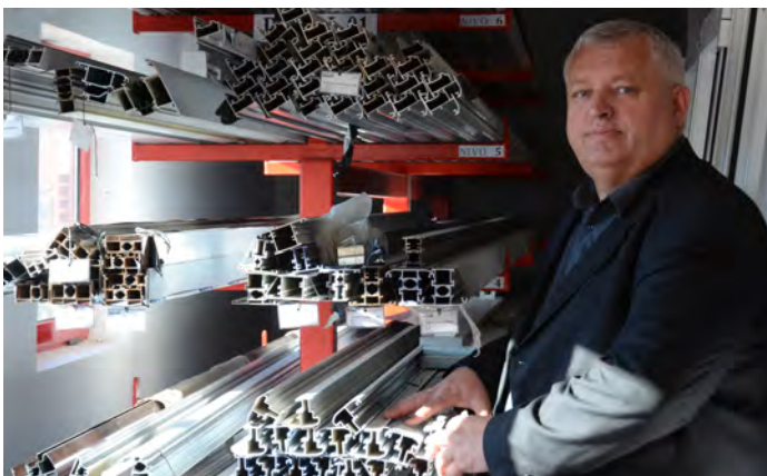
USAID je pomogao preduzetnicima iz Srbije da uvedu međunarodne standarde kvaliteta i unaprede prodaju. Cerak, Vranje.