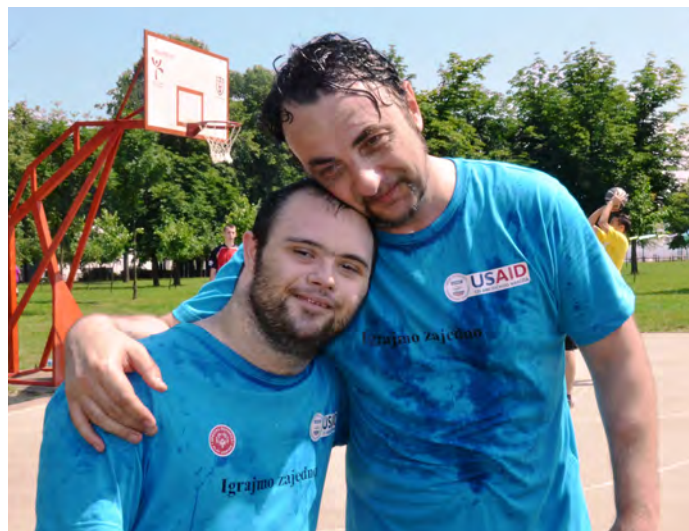
USAID je omogućio da se mladi, sa i bez intelektualne ometenosti, rade i igraju zajedno i grade društveno inkluzivne zajednice.

USAID je pomogao osnivanje Foruma za odgovorno poslovanje, koji okuplja članove vodećih kompanija u cilju podsticanja društvene odgovornosti i filantropije. USAID je takođe pomogao uspostavljanje najznačajnije nagrade za filantropiju, VIRTUS, kako bi se odalo priznanje velikim darodavcima, kompanijama ali i pojedincima.