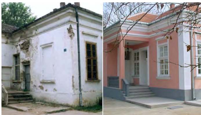
USAID je rekonstruisao i obnovio škole širom Srbije. Škola u Brestovcu pored Leskovca, Srbija.

REVITALIZACIJA LOKALNIH ZAJEDNICA: U prvim godinama pružanja pomoći (2001-2007.), USAID je finansirao više od 5.000 projekata širom Srbije kojima je unapređena infrastruktura, renovirane škole, bolnice i mesne zajednice, a podržavani su prioriteti koje su odredile lokalne zajednice.