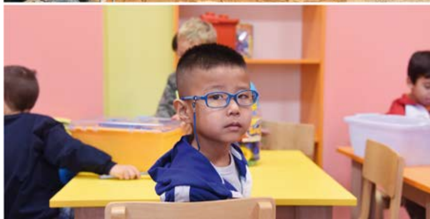
USAID je podržao i obnovu vrtića u Bašaidu pored Kikinde, kako bi se u bezbednom okruženju zajedno igrala i učila kikindska i deca migranata.