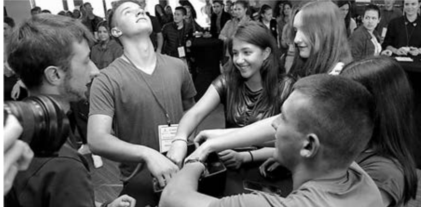
Mladi Srbije takmiče se u preduzetništvu uz podršku USAID-a.