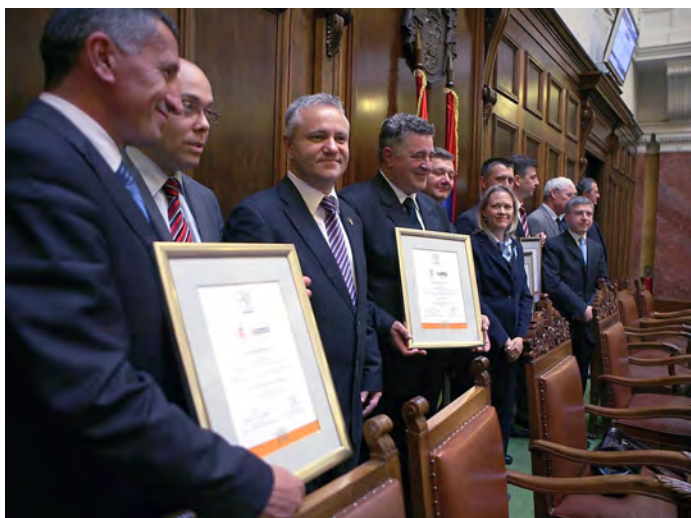
Predsednici pet opština ponosno drže sertifikate koji potvrđuju da njihove opštine imaju povoljno okruženje za poslovanje. Beograd, juni 2010. godine.

IZGRADNJA KAPACITETA: Između 2006. i 2013. godine, USAID je podržao preko 230 organizacija civilnog društva širom Srbije i obučio više od 1.500 građanskih aktivista i lidera iz 258 organizacija civilnog društva, na temu tehnika zastupanja i aktivizacije građana. Podrška USAID-a omogućila je 2006. godine osnivanje Nacionalne alijanse za lokalni ekonomski razvoj (NALED). NALED je okupio kompanije, preduzetnike i vladu i pridobio njihovu podršku za obimne reforme koje su olakšale poslovanje u Srbiji. USAID i NALED osmislili su i sproveli postupak sertifikacije opština sa povoljnim poslovnim okruženjem koji predstavlja svojevrstan pečat kvaliteta investitorima koji dolaze u Srbiju. Postupak sertifikacije je kasnije, kao uspešan model, replikovao u drugim zemljama regiona, kao što su Makedonija, Bosna i Hercegovina, Crna Gora i Hrvatska. USAID je podržao osnivanje Centra za slobodne izbore i demokratiju (CeSID) i pomogao