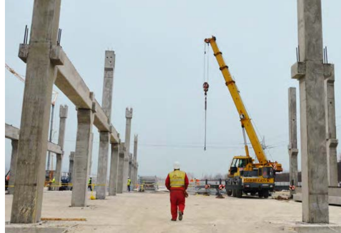
USAID je podržao razvoj i sprovođenje reformi sistema izdavanja građevinskih dozvola u Srbiji.

Reforme u oblasti građevinske industrije generisale su povećanu građevinsku aktivnost i veći broj radnih mesta u ovoj grani industrije. Ova reforma omogućila je da Srbija u izveštaju Svetske banke Doing Business za 2018. zauzme deseto mesto