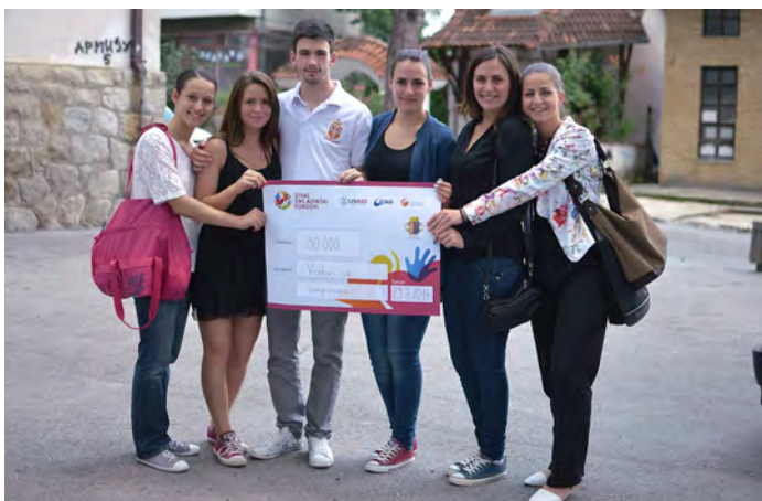
USAID i Fondacija Divac pomogli su da 97 mladih ljudi osmisle i u delo sprovedu 381 lokalnih inicijativa, jačajući novu generaciju mladih lidera.

MEDIJI: Između 2001. i 2012. godine, USAID je pomogao razvoj nezavisnih medija kao uspešnih komercijalnih preduzeća. USAID je finansirao izvore ozbiljnog izveštavanja i istraživačkog novinarstva, uključujući novinsku agenciju BETA, bivšu TV stanicu B92, radio stanice i internet portale. Skoro 1.500 novinara i drugih medijskih radnika prošlo je obuku, a više od 250 medijskih kuća dobilo pomoć USAID-a.