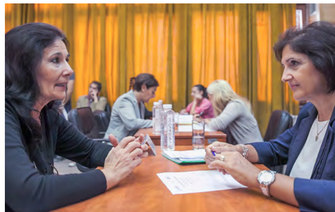
Kako bi pomogao da se inspekcijiski nadzor vrši na transparentniji način i preduzetnici rasterete, USAID je organizovao "Otvorene dane" koji su na jednom mestu okupili inspektore i vlasnike firmi što im je pomoglo da posluju u skladu sa novim propisima.

Novi Zakon o radu usvojen 2014. godine uz podršku USAID-a učinio je tržište rada fleksibilnijim, a Srbiju privlačnijom za direktne strane investicije.