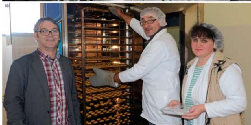
USAID je u saradnji sa Tehnološko-prehrambenim parkom iz Leskovca osnovao postrojenje za istraživanje i razvoj, kako bi prerađivači hrane osmišljavali nove i unapređivali postojeće proizvode.