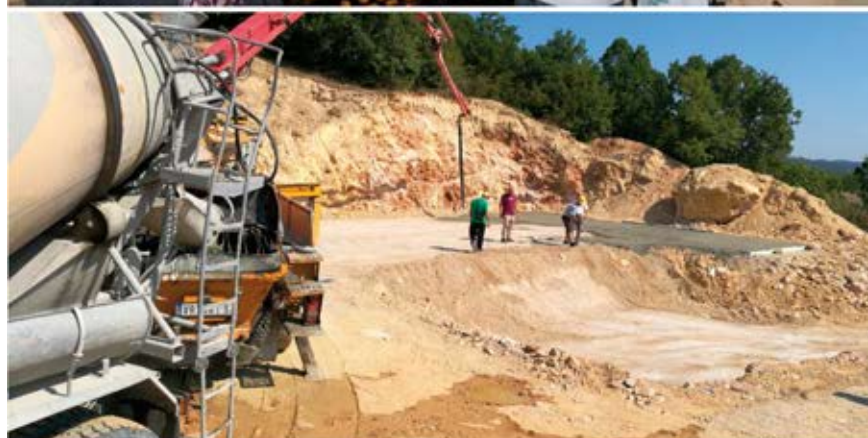
USAID je izgradio nove rezervoare za vodu u Preševu i Tutinu koji su omogućili uredno snabdevanje pijaćom vodom za stanovništvo ovih opština.