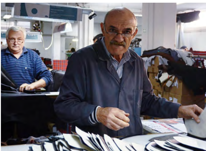
USAID je pomogao proizvođačima obuće iz Srbije da povećaju proizvodnju i otvore nova radna mesta. Stefi komerc, Vranje.

USAID je pomogao firmama i preduzetnicima u južnoj i jugozapadnoj Srbiji da se razvijaju, povećaju i osvoje nova domaća i inostrana tržišta. USAID-ova podrška za 184 firme između 2013. i 2018. dovela je do stvaranja 487 novih radnih mesta na neodređeno vreme i 159 radnih mesta na određeno. Sedamdeset i jedno malo i srednje preduzeće u vlasništvu žena i mladih dobilo je bespovratna sredstva za kupovinu opreme vredne 761.000 dolara, što je pomoglo rast i konkurentnost ovih firmi. Prethodna pomoć USAID-a firmama na jugu i jugozapadu Srbije u periodu između 2006. i 2013. omogućila im je da osvoje nova domaća i inostrana tržišta, što je dovelo do stvaranja oko 400 novih radnih mesta i prihoda na trgovinskim sajmovima u iznosu od 13,8 miliona dolara.