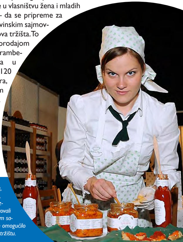
Uz pomoć USAID-a, agrobiznisi iz Srbije, kao što je ovaj proizvođač ajvara, učestvovali su na međunarodnim sajmovima – što im je omogućilo pristup inostranom tržištu.

AGROBIZNIS: USAID-ov Agrobiznis projekat koji je trajao od 2007. do 2012, pomogao je stotinama firmi – od kojih su mnoge u vlasništvu žena i mladih preduzetnika – da se pripreme za učešće na trgovinskim sajmovima i osvoje nova tržišta. To je rezultiralo prodajom srpskih prehrambenih proizvoda u vrednosti od 120 miliona dolara, i to uglavnom kroz izvoz na tržišta u regionu. Uspeh ovih firmi doveo je do stvaranja oko 7.000 novih radnih mesta.