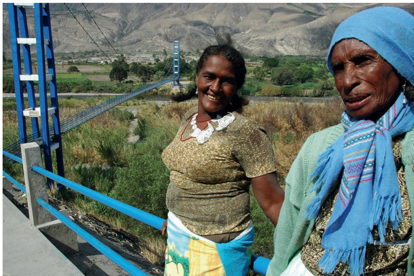
Presupuesto USAID (y predecesores) en Ecuador