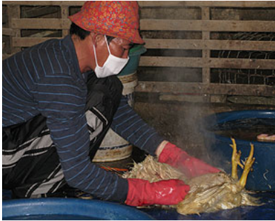
USAID và đối tác giúp nâng cao nhận thức về cúm gia cầm cho nông dân ở Việt Nam (Richard Nyberg, USAID)