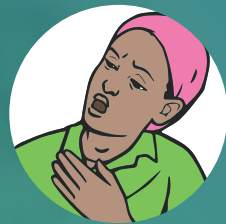
Afuura baafachuu fi galfachuu dadhabuu