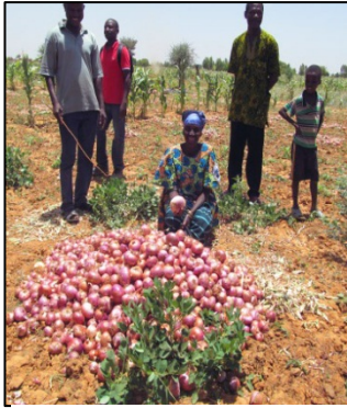
Une femme devant sa récolte d'oignons